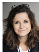
Lone Wiggers Partner, Arkitekt maa, mna C.F. Møller Fremtidens almene bolig